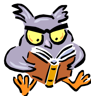
Giovane lettore alato della Biblioteca

Oppure consegnando il tuo articolo direttamente in Biblioteca. Almeno due dei contributi più interessanti giunti in redazione verranno pubblicati in questo notiziario. Tra le diverse rubriche proposte c'è la possibilità per grandi e piccini di presentare un libro letto che a loro è particolarmente piaciuto